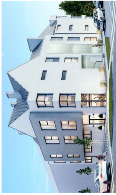
WIDOK NAROŻNIKA BUDYNKU OD UL. WISŁAWY SZYMBORSKIEJ