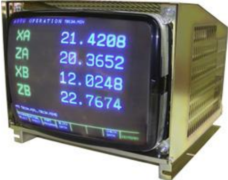
Oryginalny monitor CRT