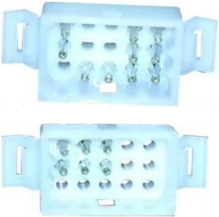
Podłączenie monitora kolorowego