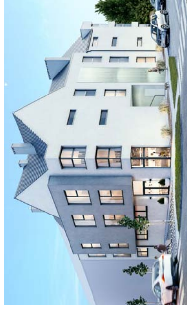
WIDOK NAROŹNIKA BUDYNKU OD UL. WISŁAWY SZYMBORSKIEJ