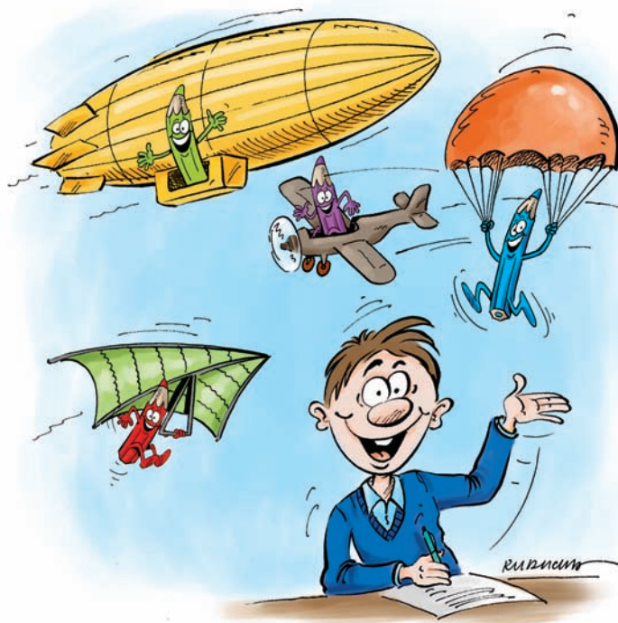
I PASSED MY GIMNAZJUM EXAM WITH FLYING COLOURS!