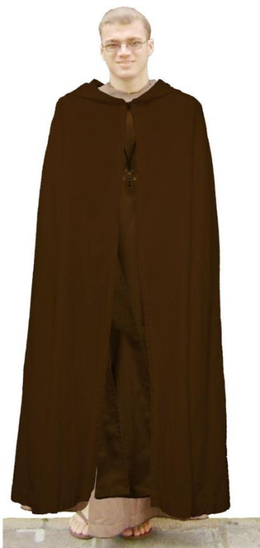
Wyjściowy - na chłodne dni