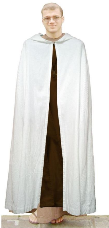
Chóralny - Liturgiczny