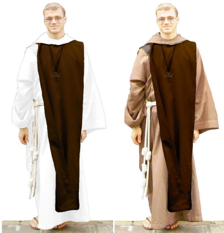
Strój brata uroczysty

W obecnym czasie we wspólnocie nie ma osób konsekrowanych